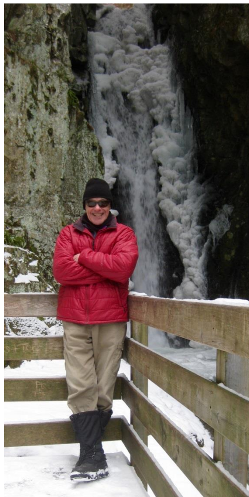
These places help make my waiting to travel a little easier