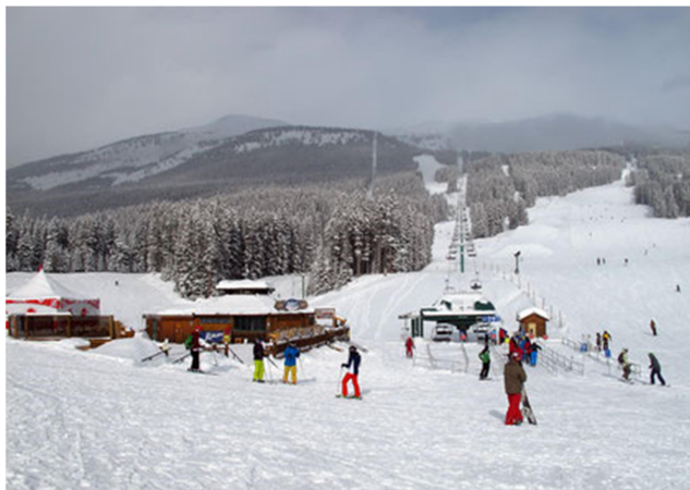
Lake Louise (foto RHe).

Een aantal van deze punten is waar. Een tijds-verschil van 8 uur is niet altijd lekker, maar een nacht in een bus naar de Alpen is dat ook niet. De reis van deur tot deur duurt zo'n 18 uur, nauwelijks langer dan een busreis naar Les Menuires of Canazei. Een reis naar Canada is duurder, maar de forse prijsverhogingen van hotels in de Alpen in komend seizoen en de lage dollar reduceren het prijsverschil aanzienlijk. Voor iets meer geld biedt de reis naar Canada een unieke "once-in-a-lifetime" ervaring. Skiën in de schitterende natuur van Nationale Parken in de Rocky Mountains op uitdagende pistes met vaak heerlijke sneeuw.