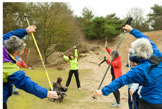
Met SneeuwFit-training bereid je je goed voor