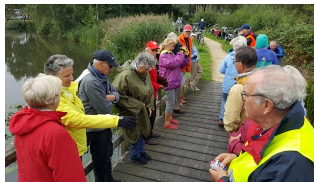
De brug hield het wel.