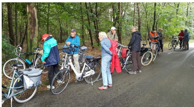
Soms een buitje...