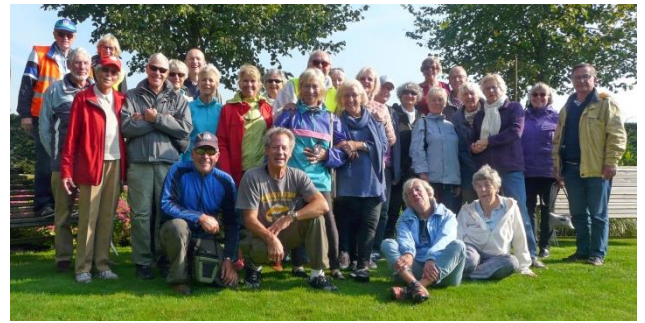
Koffiestop in de theetuin.