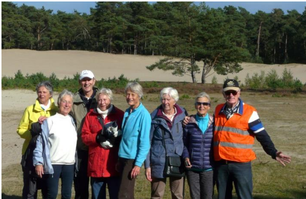
Prachtige zandverstuiving.