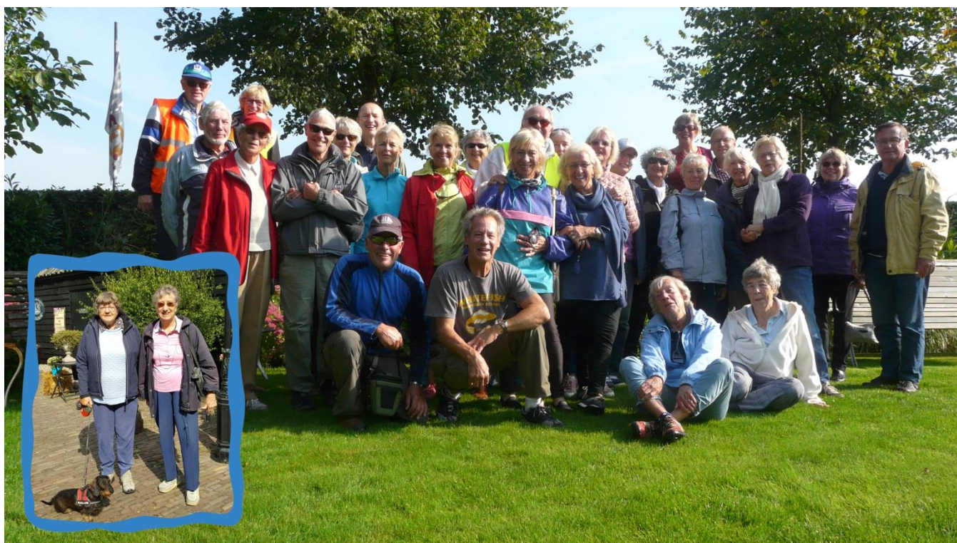
Alle deelnemers van het Fietsweekend 2017 in Ommen.