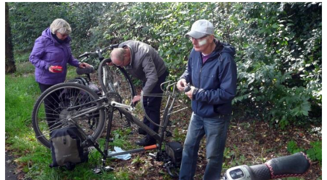
Lekke band hoort er helaas ook bij.