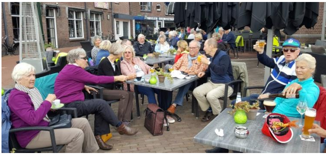
Afsluiting dag 2 bij Tante Pos.