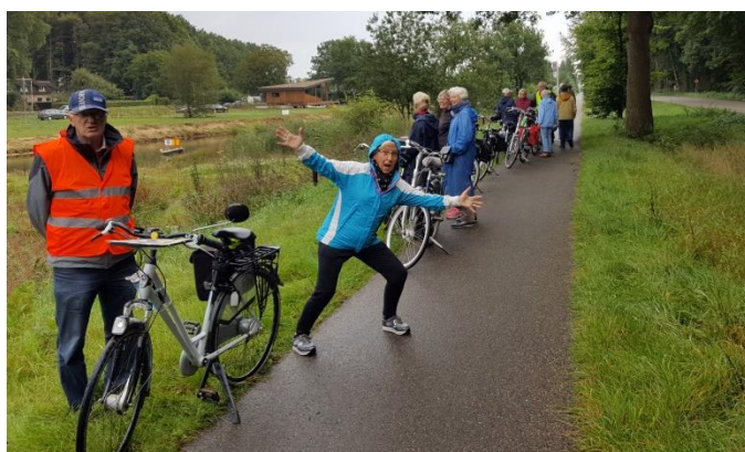
Maar we bleven vrolijk.