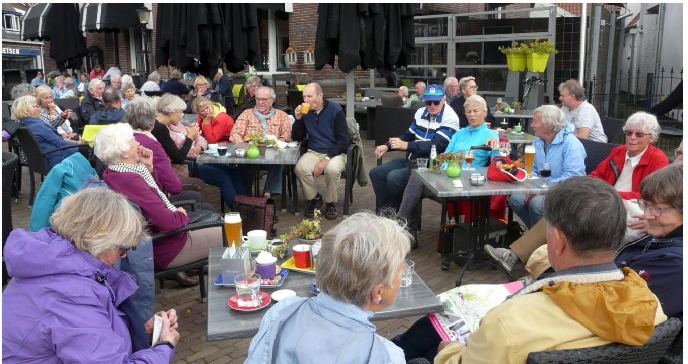
En als afsluiter van de laatste dag: borrelen bij Tante Pos in het centrum van Ommen.