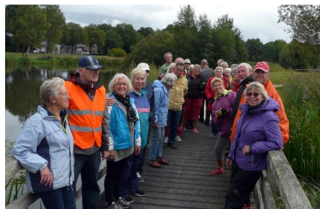
Er kan nog meer bij...